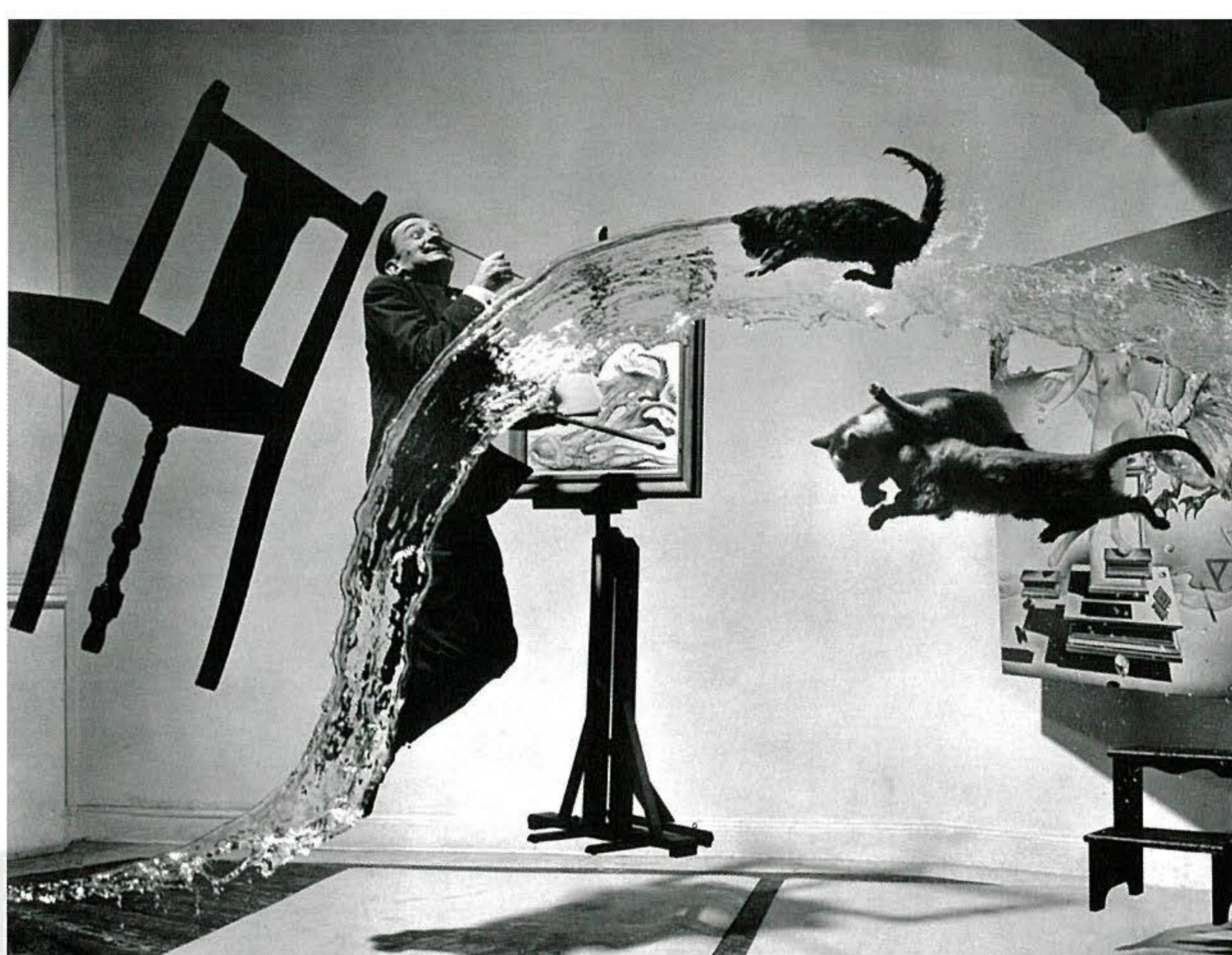
《ダリ・アトミクス》 Dalí Atomicus, 1948