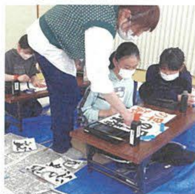
けいぼく・アート書道教室

西会津在住。幼い頃から書道に親しみ、2018年にけいぼく・アート書道教室をスタートさせる。教室開催の他、自作の俳句や詩文を書にする活動を行う。 Instagram/@keikou358