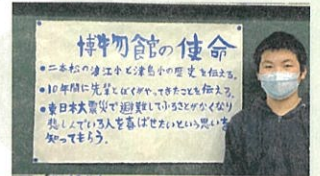
10年間ふるさとなみえ博物館