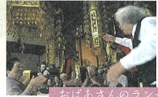
おばあさんのランチ