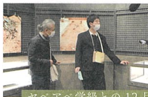
ヤヘアへ学級との12月