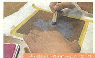
会津型で何つくる？