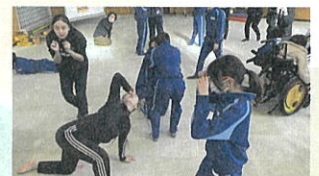
感じるリズム見つけるカラダ ／とぶまなびーや